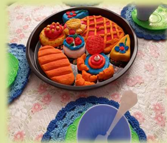
Лепка из соленого теста «Мы пекари»