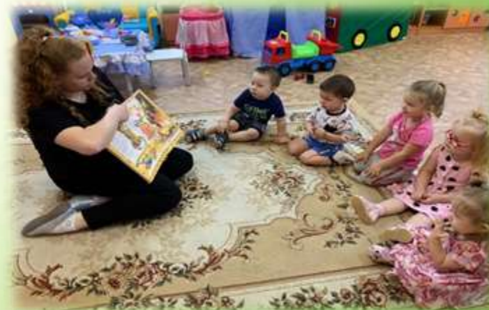
Экскурсия в группу д/с «Лягушонок» - место работы мамы Матвея К.