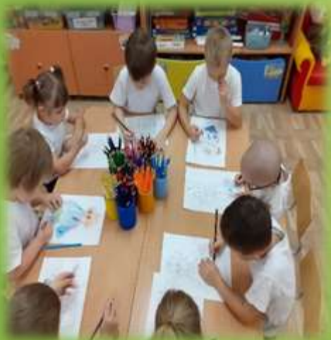
Работа по теме в раскрасках