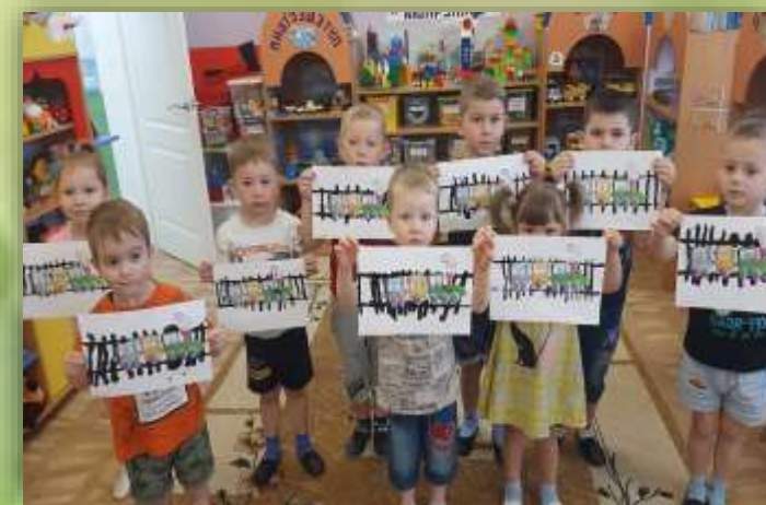
Рисование «Железная дорога для машиниста»